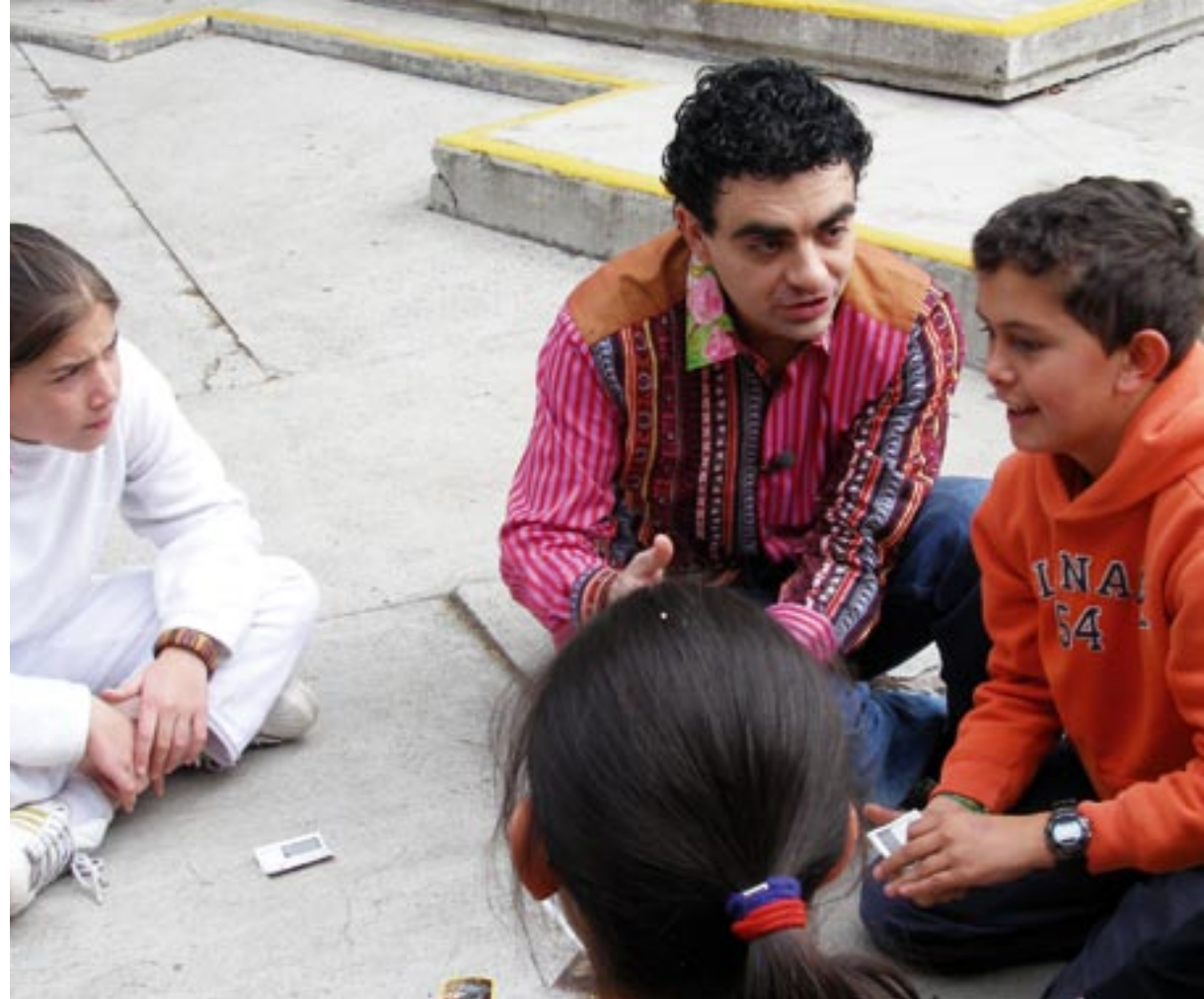
Im Gespräch mit Schülern: Rolando Villazón, Opernsänger und Absolvent der Deutschen Schule Mexiko-Stadt

Durch das Pädagogische Qualitätsmanagement wird das Markenzeichen „Deutsche Auslandsschule“ zukünftig noch größere Anerkennung genießen. Dieses heißt aber auch, dass nur solche Schulen zu diesem Kreis gehören können, die dem Qualitätsverständnis für Deutsche Auslandsschulen entsprechen und ein deutsches Schulziel (z.B. Mittlere Bildungsabschlüsse, Abitur und berufliche Qualifikationen) und ein entsprechendes deutschsprachiges Unterrichtsprogramm anbieten.