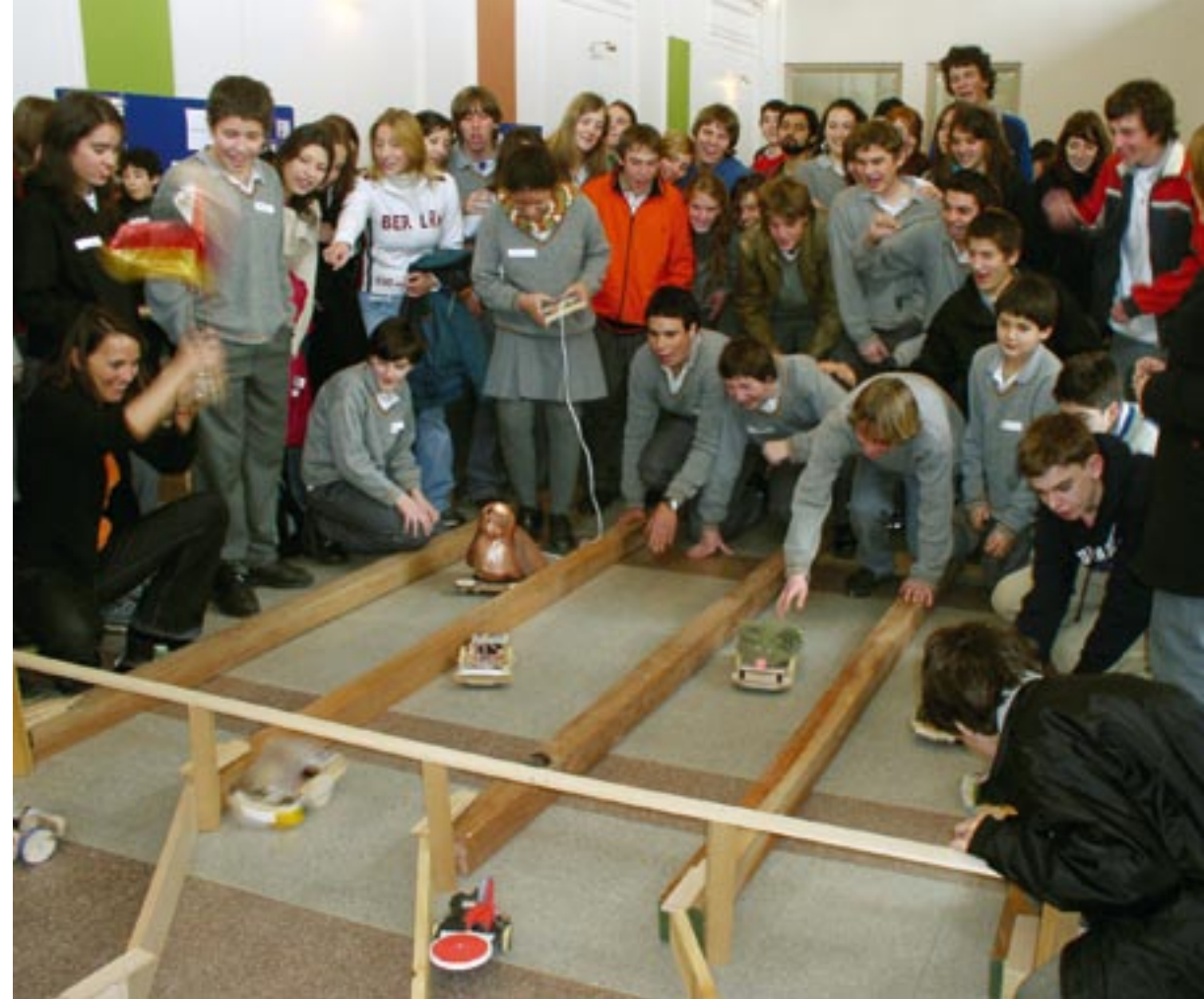
Robotik-Wettbewerb an der Deutschen Schule Santiago

Deutsche Auslandsschulen zeichnen sich seit jeher durch ein hohes Maß an Eigenverantwortung, Profilbildung und unternehmerischem Handeln aus. Sie sind geprägt durch umfeldbezogenes Arbeiten, präsentieren sich in der Öffentlichkeit und erwirtschaften Finanzmittel. Insofern kommt der innerdeutsche Trend zur eigenverantwortlichen Schule dem Charakter und Selbstverständnis der Auslandsschulen entgegen. Bislang erfolgte die finanzielle und personelle Förderung sowie die Anerkennung und Genehmigung der Curricula und Abschlüsse jedoch noch auf der Basis von engen Richtlinien und Vorgaben. Mit dem Aufbau eines Pädagogischen Qualitätsmanagements (PQM) geht ein Perspektivenwechsel einher: Neue Instrumente der Outputsteuerung ergänzen oder ersetzen zunehmend die bisherige Inputsteuerung. Auf diese Weise kann Eigenverantwortung mit Qualitätssicherung verbunden werden.